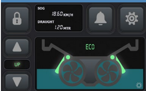
FLEX TUNNEL TOUCHSCREEN BESTURINGSPANEEL

Omdat de gehele scheepsromp moet worden ontworpen op de inbouw van de FLEX Tunnel, is deze innovatie alleen geschikt voor nieuwbouw schepen.